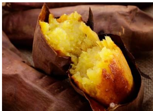
この写真はイメージです。